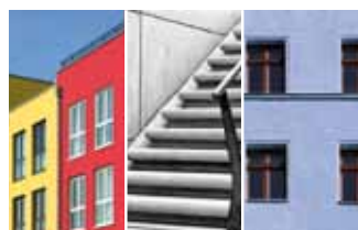
Anti Graffiti Number Three