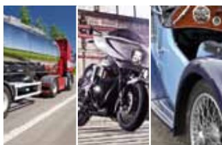
Vehicle Shield Number One