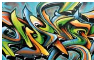
Anti Graffiti Number One